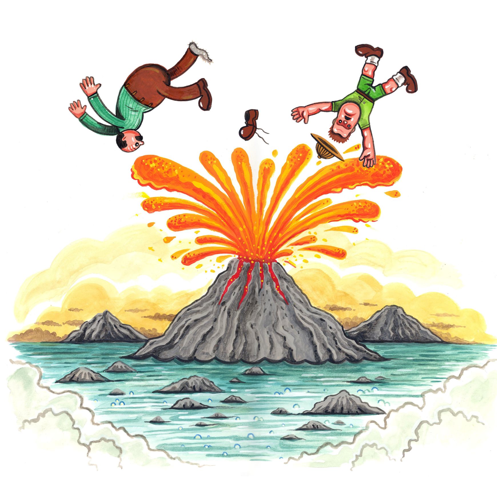
En 1990, une nouvelle vie a commencé pour mon père et moi ...