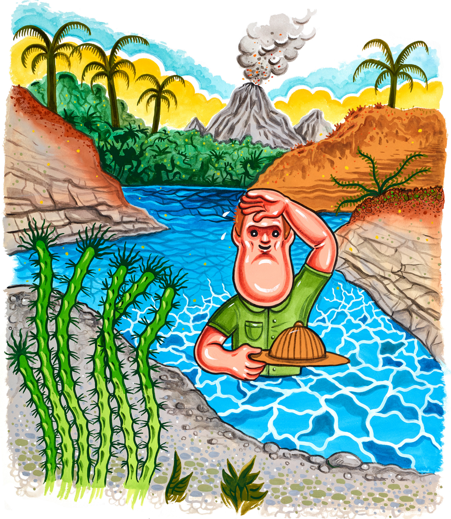
Rein de tel pour capter l'attention d'ados de 13 ans. Jétais incollable sur la question. J'avais du mal à parler de moi, mais sur les dinosaures, je pouvais monologuer pendant des heures.